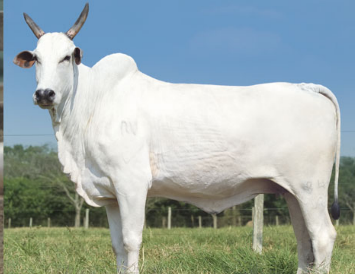
Ek POI da RV x Chummak RGD: L - 496 Nac.: 14 - 11 - 89