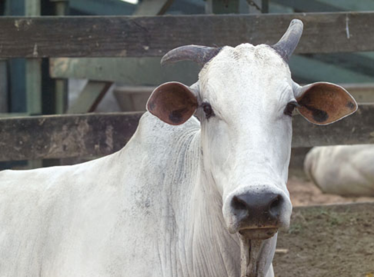
Fallon MJ do Sabia x Maranamu POI da Zeb RGD: AA-1344 Nac.: 13 - 12 - 90