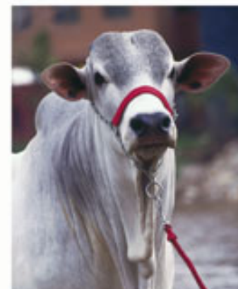
Hija: INTOCABLE TE ( Concepción x Idilio )

En el Sumario del Geneplus de EMBRAPA se clasificó TOP 4% por su Índice de Calidad Genética de 1,85. Súper destaque en las fases de cría y recria, clasificada TOP1% para peso a los 120 días tanto directa como indirecta, TOP 3% para peso al destete, TOP 0,5% para total maternal al destete y TOP 2% para peso al sobre año.