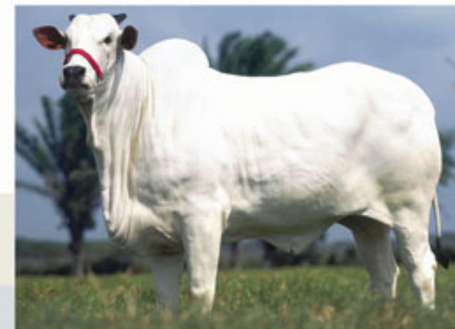
Hija: RUBIA TE LS ( Concepción x Idilio )